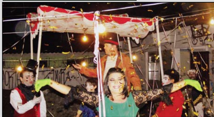
Cena de abertura do espetáculo "Caminhos da Independência" - versão 2012.