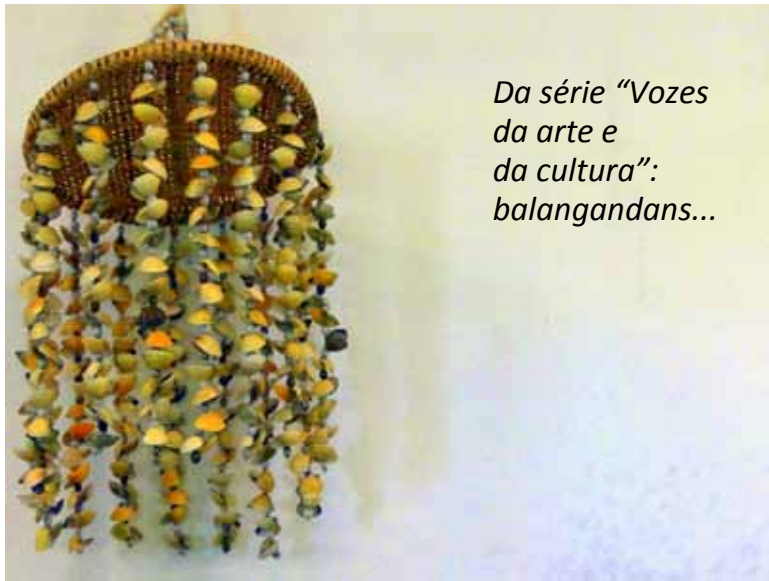
Da série “Vozes da arte e da cultura”: balangandans...