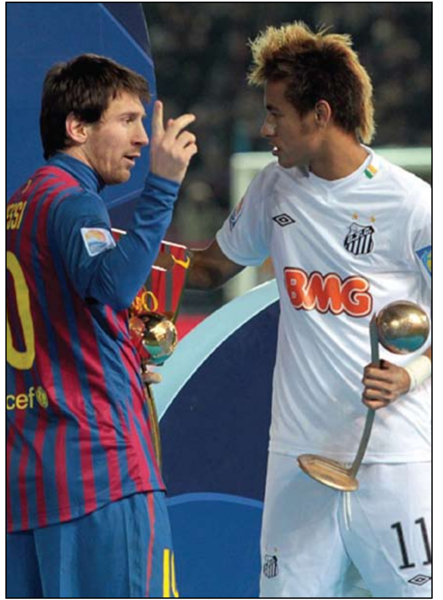
Neymar e Messi podem jogar juntos a partir de 2013, logo após a Copa das Confederações

Se não tem mais condições físicas, que se afaste definitivamente. Resolvida essa questão,