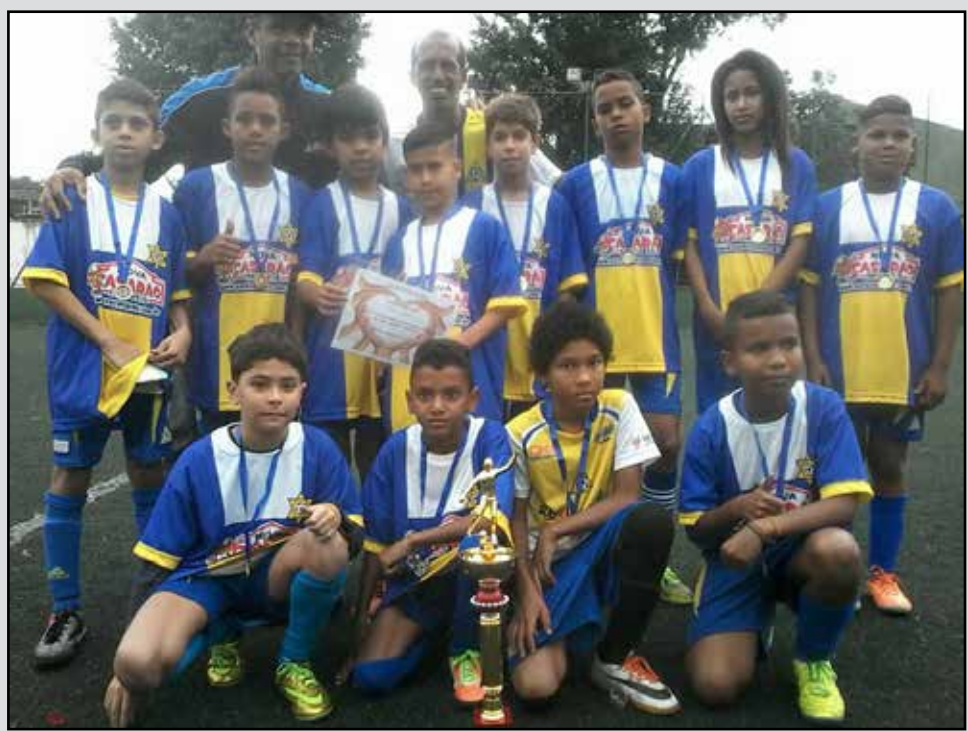
ilustração: A Equipe Delta de Praia Grande sagrou-se campeã no Sub 11 da 2.ª Copa Infantil Society.