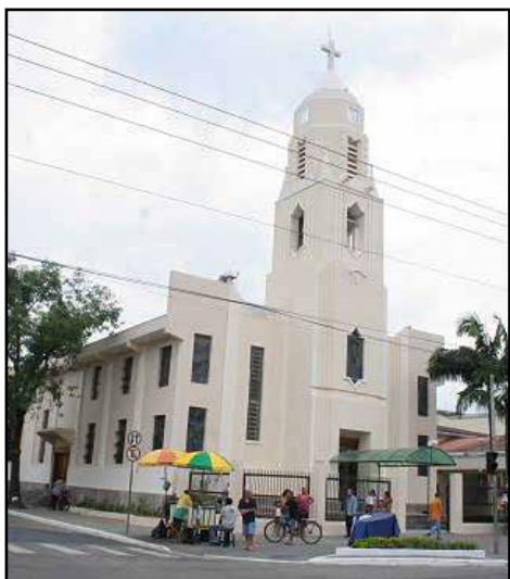
A Banda Mistério da Fé (no alto) se apresenta na Igreja Matriz de Cubatão (acima) em festa dedicada ao dia da Padroeira da cidade, Nossa Senhora da Lapa.

As missas da novena em homenagem à Padroeira de Cubatão prosseguem nesta sexta-feira, sábado e domingo, sempre às 19 horas, na igreja matriz.