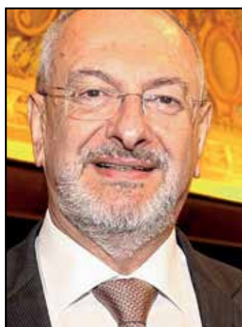
Sou ecologista de carteirinha. Sunita ambiental. Fundamenta-

lista verde. Sofro quando vejo a barbárie a devastar florestas, a conspurcar a água, a matar o solo e a juntar resíduo que transforma o planeta num grande lixo. Talvez por ser neto de um imigrante italiano que não tinha terra e que passou a vida a plantar, hábito que transmitiu a pelo menos um dos 14 filhos, o meu pai, sou também plantador. Coleto sementes, faço-as germinar, tento fazer compostagem, esverdearia o mundo se pudesse.