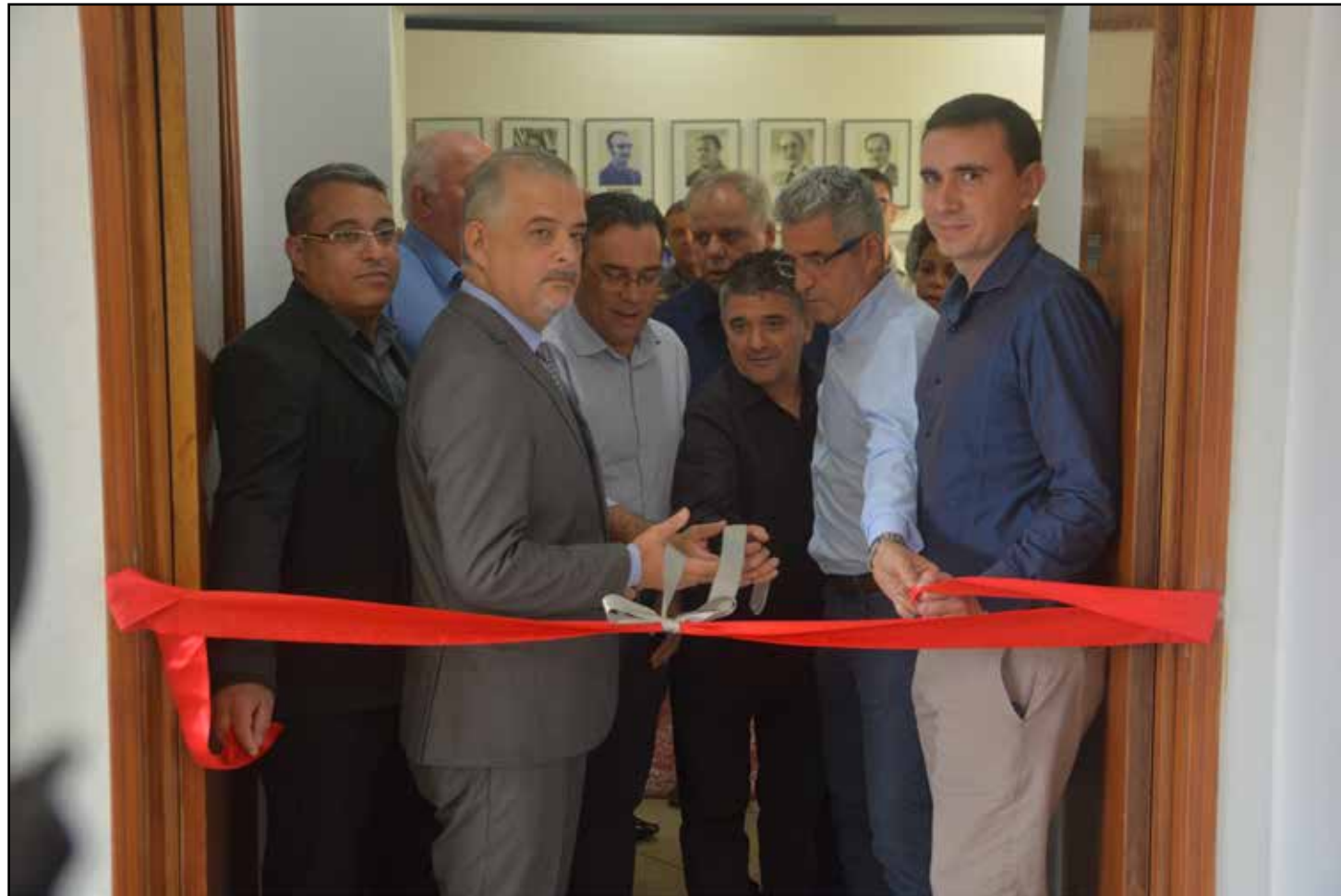
Poupatempo do Empreendedor funciona desde o final de novembro