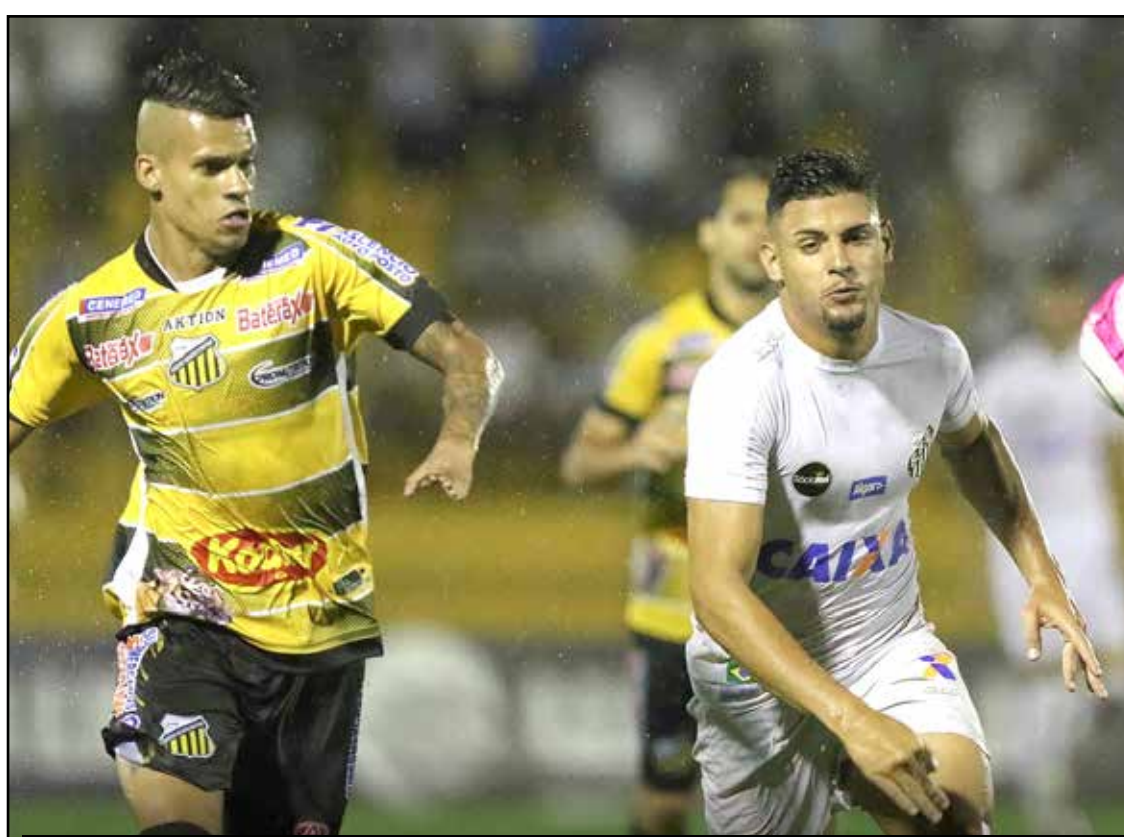
YURI ALBERTO MARCOU PELA PRIMEIRA VEZ PELO SANTOS

Os atacantes Cope e Gabriel Barbosa, além do zagueiro David Braz ficam à disposição do técnico Jair Ventura para retornarem ao time.