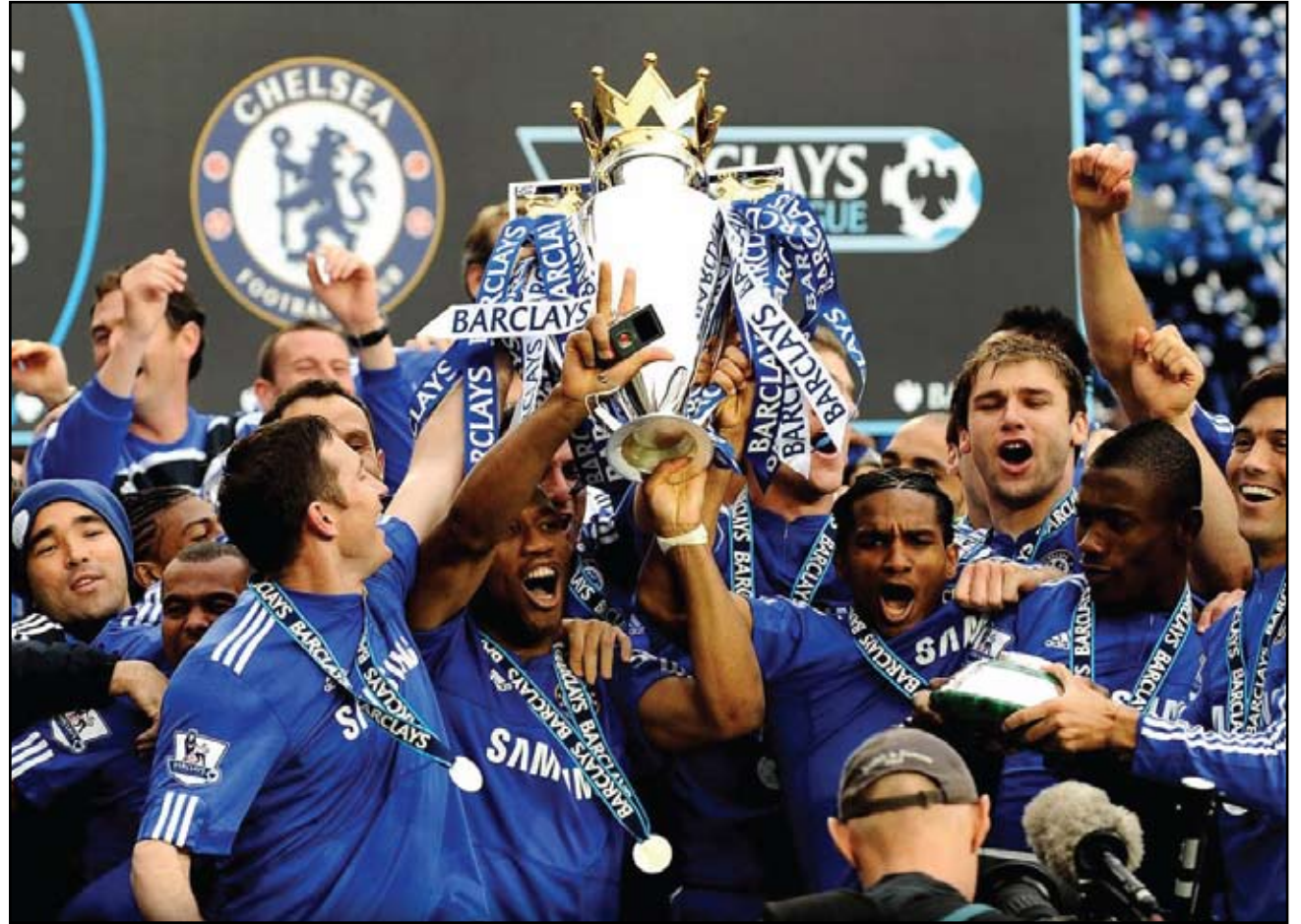
O Chelsea, campeão da Liga Européia, teoricamente é um adversário menos perigoso que o poderoso Barcelona de 2011, mas ainda mantém o favoritismo para o Mundial de 2012.

Teoricamente, o Chelsea é até favorito, em fun-