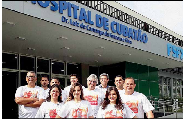
Desde outubro de 2017, o Hospital de Cubatão está sob gestão da FSFX