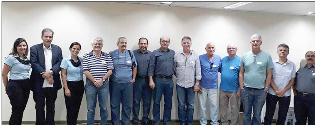
Desde outubro de 2017, o Hospital de Cubatão está sob gestão da FSFX

Um dos compromissos assumidos pela Fundação São Francisco Xavier - FSFX, logo que assumiu a gestão do Hospital de Cubatão, era a manutenção de um canal de relacionamento com a comunidade. Nesse sentido a entidade, que realiza com o sucesso atividades semelhantes em outras regiões do país, implantou o Conselho Consultivo de Clientes da Baixada Santista, formado por 20 beneficiários do plano Usisaúde, escolhidos mediante a frequência de utilização dos servi-